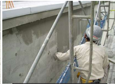
〈薄付け仕上げ状況〉