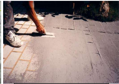
〈パターン仕上げ状況〉